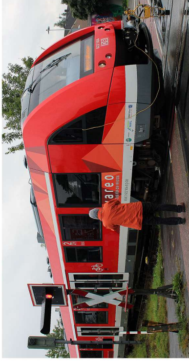
Am 10. September 2017 befuhr ein Dieseltriebwagen der Baureihe 622 (LINT 54) probeweise die WLE-Bahnstrecke nach Sendenhorst.

Wolbeck. Seit genau 50 Jahren ist der geschichtsträchtige Ort Wolbeck im Öffentlichen Personennahverkehr nicht mehr auf der Schiene sondern lediglich noch mit dem Bus erreichbar. Schon wenige Jahre nachdem 1975 der Personenverkehr auf der Strecke der Westfälischen Landeseisenbahn zwischen Münster und Neubeckum eingestellt worden war, gründete sich in Wolbeck eine Initiative, die sich gegen eine neue Straßenumfahrung des Ortes wandte und für die Reaktivierung des Schienenverkehrs auf den WLE-Gleisen aussprach. Seitdem wuchs – erst langsam, später aber schneller und sehr breit in der Gesellschaft verankert – der Wunsch, wieder mit dem Zug von Wolbeck nach Münster fahren zu können.