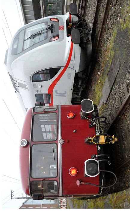
Der NWL ließ Ende vergangenen Jahres einen Schienenbus auf der WLE-Strecke von Münster nach Sendenhorst pendeln. In Münster traf das historische Bahnfahrzeug auf einen Intercity der DB.