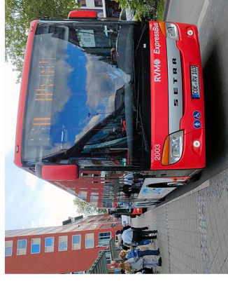
Der Regiobus X 90 endet nun am Hauptbahnhof.

Martinviertel. Grüne, SPD und Volt wollten im Mobilitätsausschuss der Stadt Münster (AVM) die Weiterfahrt der Regiobusse S 60 aus Nottulin, S und X 90 aus Senden / Lüdinghausen wieder bis zum Bült erreichen. Andrea Blome (Grüne), Vorsitzende des Ausschusses, erklärte auf Nachfrage der Redaktion: „Wir haben unseren Antrag nach einer längeren Debatte im AVM modifiziert.“ Der Protest gegen das eigenmächtige Verhalten von Stadtverwaltung und RVM wird kritisiert und „langfristig“ wird auch die Weiterfahrt der Regiobusse zur Haltestelle Altstadt / Bült gefordert. Unzufrieden stellte Andrea Blome fest: „Wir mussten feststellen, dass die Verwaltung unser Anliegen, für die RVM zum 1. September Bedingungen zu schaffen, die eine kurzfristige Rückkehr der Schnellbusse auf den alten Linienweg und eine Buswende am nördlichen Schlossplatz ermöglicht, nicht umsetzen will. Wir bekräftigen, dass wir die direkte ÖPNV-Erreichbarkeit der Innenstadt für das Umland weiterhin stärken wollen.“