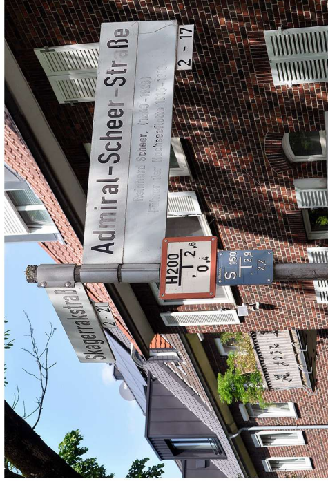
Im „Marineviertel“ sollen auch die Admiral-Scheer-Straße und die Skagerrakstraße umbenannt werden.

Doch der Beschluss könnte die Stadtgesellschaft noch länger beschäftigen, denn direkt im Anschluss an die Sitzung verkündete die Bürgerinitiative „Stopp Umbenennungen“, dass sie die Entscheidungen mit einem Bürgerbegehren anfechten wollen.